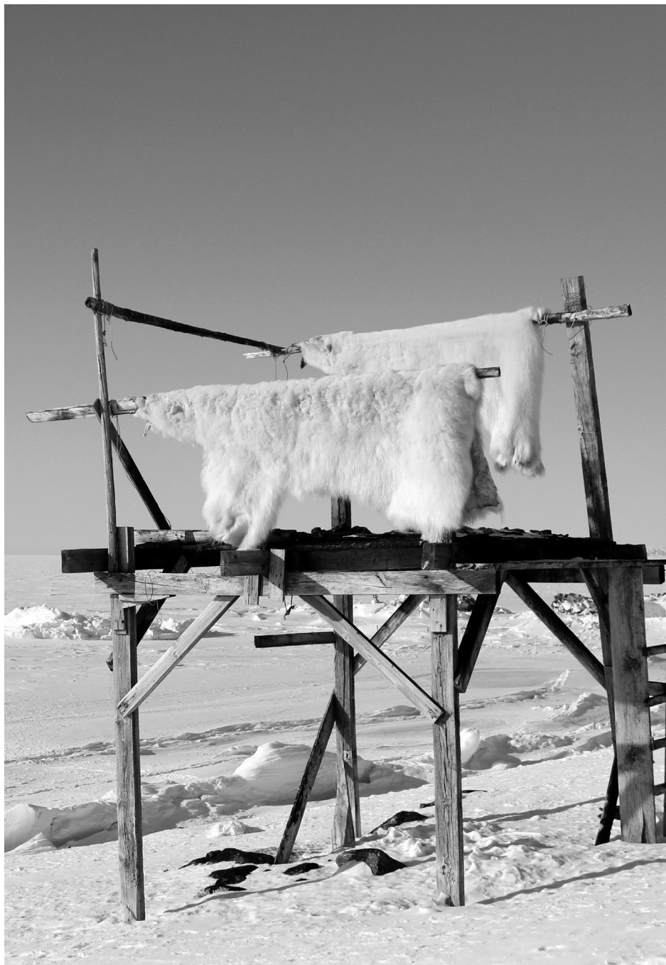
Assiliisoq/fotograf: Kristin Laidre