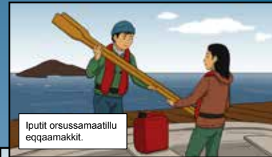
Ipunit orussamaatillu eqqaamakkit.