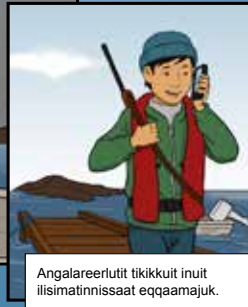
Angalareerlutit tikikkuit inuit iisimatinnissaat eqqaamajuk.