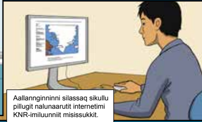
Aallanginninni silassaq sikulu pillugit nalunaarutit internetimi KNR-imiluunniit misissukkit.