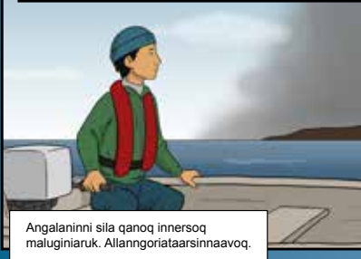
Angalaninni sila qanoq innersoq maluginiaruk. Allangoriataarsinnaavoq.