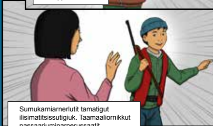
Sumukarniarerlutit tamatigut iisimatitsissutigiuk. Taamaaliornikkut nassaariuminarnerussaait.