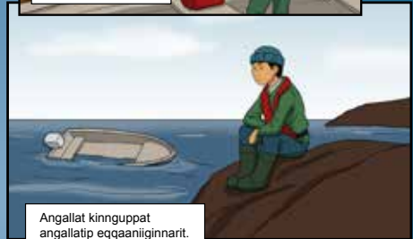
Angallat kingguppat angallatip eqqaaniinnarit.