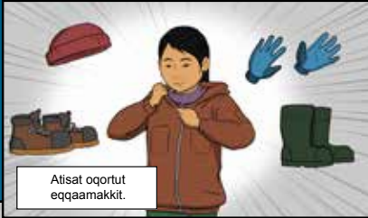
Atisat oqortut eqqaamakkit.