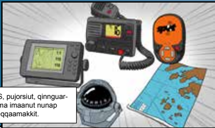
VHF, GPS, pujorsiuat, qinnguartaat aamma imaanut nunap assinga eqqaamakkit.